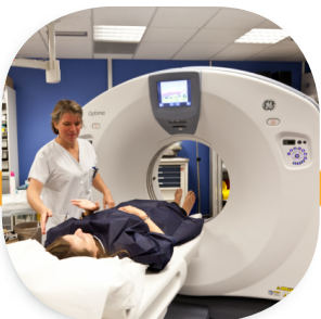
...en permettant une prise en charge de qualité