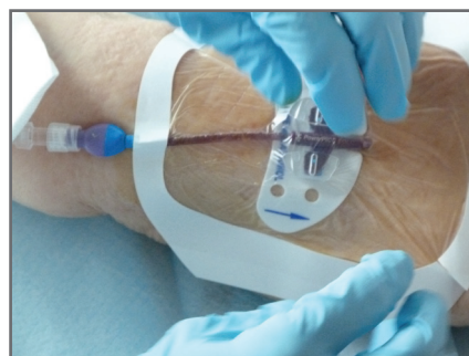
11 — Poser le pansement transparent adhésif