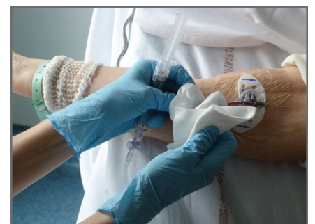
12 — Effectuer un rinçage pulsé avec la seringue pré-remplie