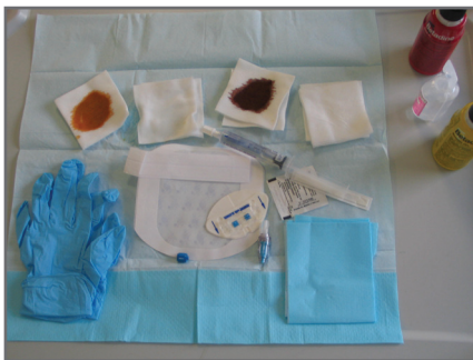
7 — Déposer le StatLock® et la seringue pré-remplie sur le champ - Verser les antiseptiques