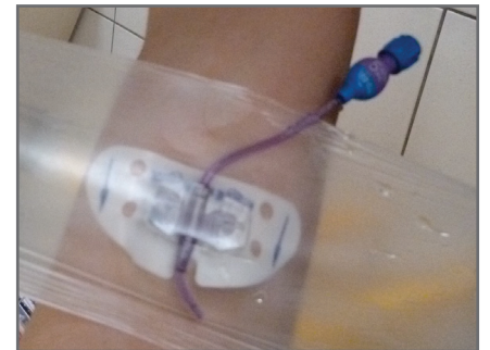
6 — Retirer le pansement transparent par étirement latéral - Retirer le StatLock® - Fixer le cathéter avec une bandelette adhésive - Enlever les gants