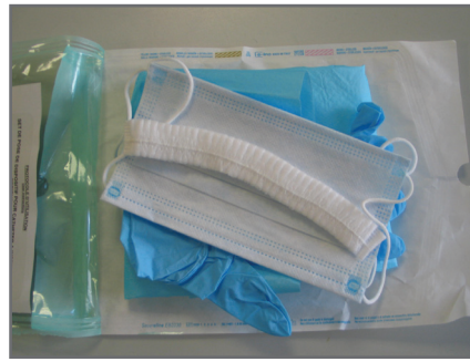
2 — Ouvrir le set