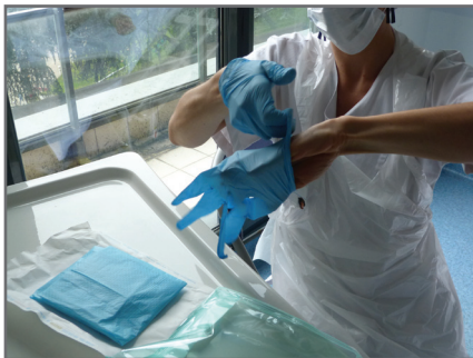
4 — Enfiler la 1 ère paire de gants stérilement