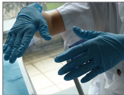
8 — Positionner le champ de protection sous le bras - Faire une désinfection - Enfiler la 2 ème paire de gants stérile