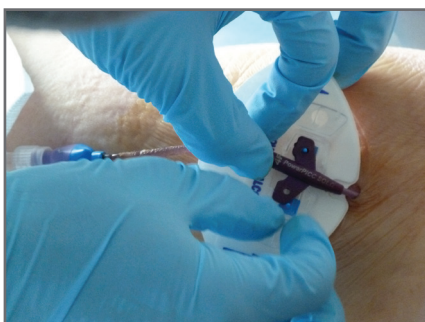
10 — Ajuster le cathéter dans le Statlock® flèches orientées vers le point de ponction - Fermer les ailettes avant de coller le StatLock®