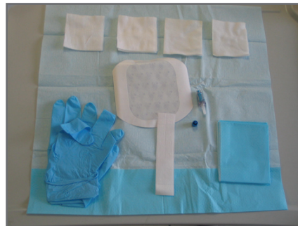
5 — Déployer le champ et répartir les composants en positionnant les gants, les bandelettes adhésives et le champ en bordure du champ