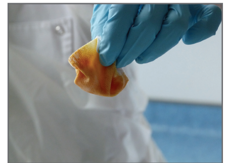
9 — Réaliser l'asepsie en 4 temps