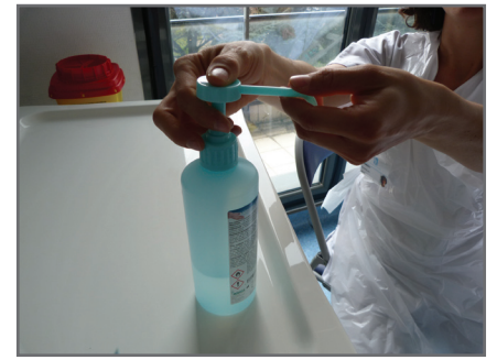
3 — Réaliser une désinfection