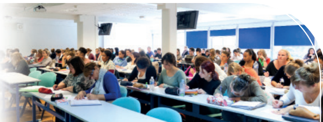
ANTHARES France ▶ www.anthares-creation.com