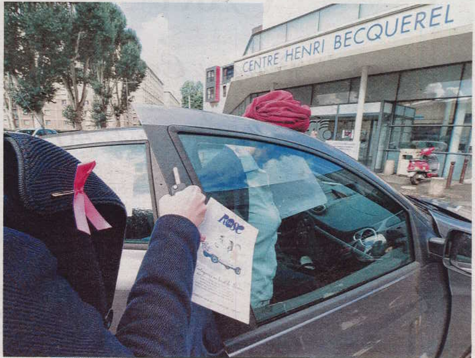
RoseCar permet le covoiturage entre des patients d'un même centre de soins ou d'un centre proche